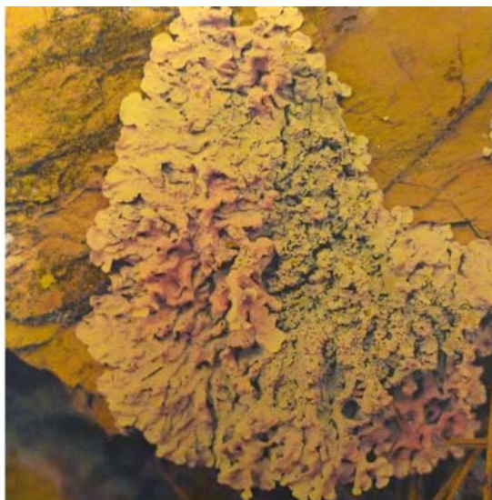
Fig. 4. Detalles de La pell de la pell , 2014. Cristina Pastó. Planchas de fotopolímero de dimensiones variables.