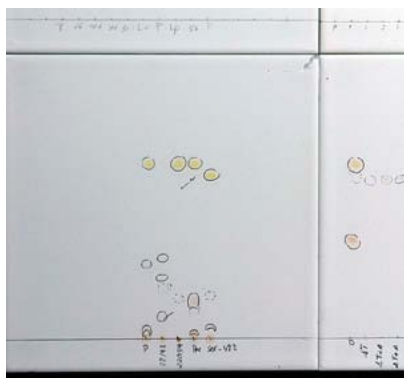
Fig. 3. Detalle de La pell de la pell , 2014. Cristina Pastó. Cromatografías, 20cm x 20cm.

protección reaccionan y varían su aspecto según la ubicación geográfica y los cambios de clima producidos a lo largo del año. Las cromatografías dispuestas una tras otra, construyen una pared blanca contigua a otra pared irregular constituida por placas de polímero fotosensibles donde figuran impresas las imágenes de unos líquenes. Estas hacen alusión a un tercer muro situado físicamente en otro lugar: la fachada de hormigón biológico del Centro Cultural Aeronáutico del Prat del Llobregat, estructura viva que permite el crecimiento de ciertas familias de microalgas, hongos, líquenes y musgos.