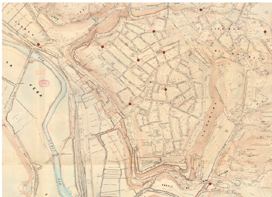
4 Valor residual, gráfico y numérico, de los puntos de control del plano de la ciudad de Teruel copiado en 1811 y del plano levantado en 1912. Elaboración propia