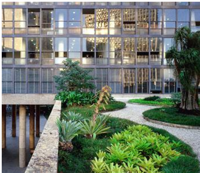
3. Ministerio de Educación y Salud, jardines del paisajista Roberto Burle Marx.

corbusiana se incorporan trabajos de artistas plásticos, como las esculturas de Bruno Giorgi, Celso Antonio y Jacques Lipschitz, los murales de Cândido Portinari, además de los jardines del pintor y paisajista Roberto Burle Marx.