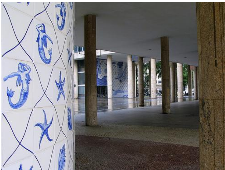
4. Ministerio de Educación y Salud, planta baja – pilots e azulejos.

vamos a presenciar la entrada de la noción de monumento en las discusiones del campo arquitectónico internacional. Analizar este cambio de posición nos ayuda a comprender los distintos factores que confluyen en la propuesta del edificio del Ministerio.