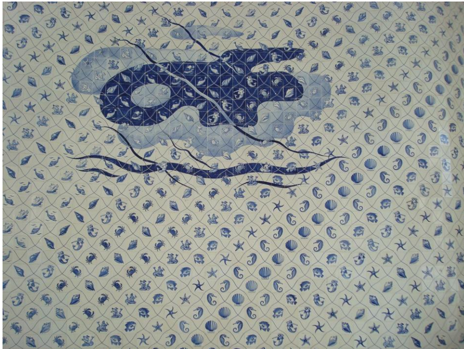
5. Ministerio de Educación y Salud, azulejos en motivos marinos de Candido Portinari

Intencionalmente o no las características de monumento atribuidas al Ministerio condicen con el ambiente cultural que lo produjo, en el que el tema de la brasileñidad gana importancia en la concepción de una arquitectura que se anhelaba expresión del país y representativa de una institución dedicada a la educación y a la cultura. La idea de nación era un factor de cohesión importante en la política del gobierno Vargas, de carácter autoritario y populista. Por otro lado, la presencia de Lúcio Costa como líder del equipo que proyecta el Ministerio reverbera en sus constantes inferencias en lo que atañe a la representatividad del edificio, lo que acrecentaba al proyecto características poco ligadas a la pura racionalidad. Además, tenemos la proximidad de Lúcio Costa con las cuestiones ligadas a la preservación, en las que el término monumento nunca perdió su prestigio en sus aspectos de memoria e identidad.