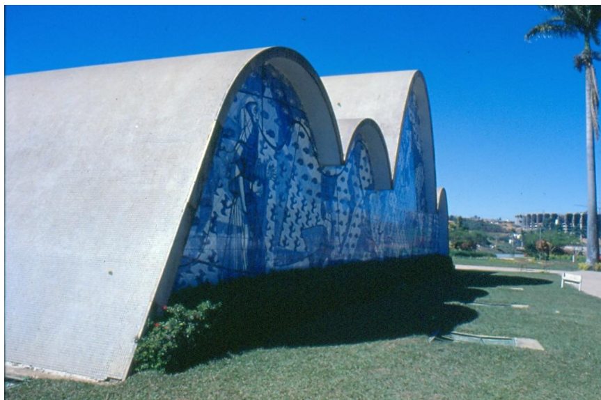
6. Igreja da Pampulha, projeto Oscar Niemeyer, panel en azulejos Candido Portinari