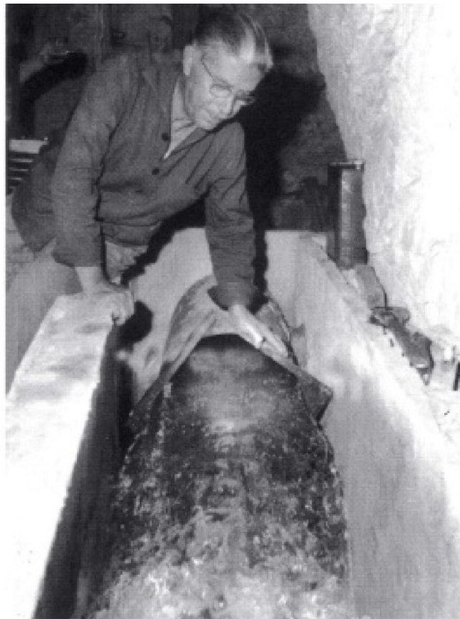
Figs. 3 y 4. Bombeo electrificado en la galería inferior de la Font de l'Arc (en torno a la década de 1960), cuya construcción se inició en la década de 1840, al igual que la ampliación de l'Assut Gran (arriba), hoy bajo las aguas del pantano de Amadorio.