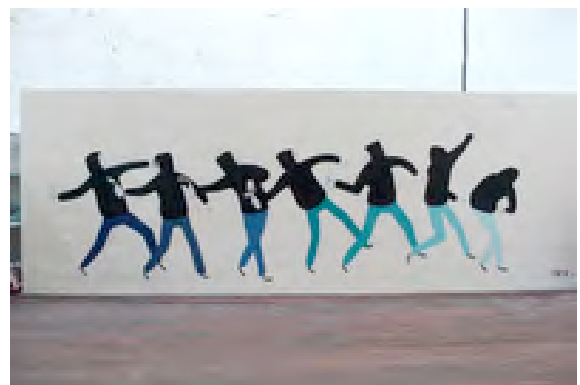
Fig.3a Escif, Fame Festival (Grottaglie, Italia, 2010), 3b. Vandalism Choreography (Valencia, 2009)