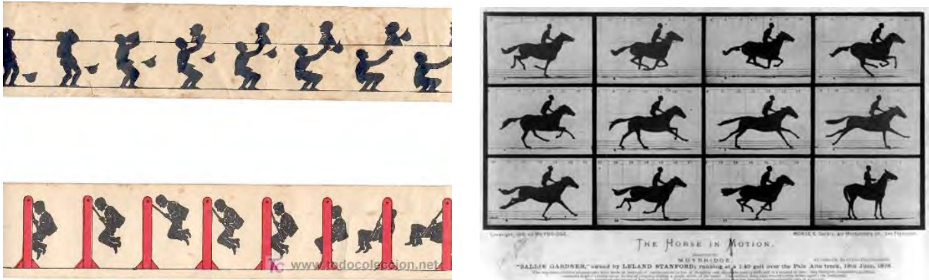
Fig.4a y 4b. Imágenes de tiras de dibujos para zoótropo

Las imágenes de Hyuro y de Escif, al igual que las tiras animadas del juguete, despliegan una acción que realiza un personaje dentro de un plano, el muro o el papel. En el caso del alce de Hyuro, por ejemplo, el automóvil circulando por la carretera ejerce la función del zoótropo.