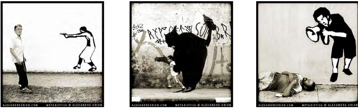
Fig. 8a, 8b y 8c. Tres fotografías del proyecto Metabióticos de Alexandre Orion.

Otro ejemplo de graffitis interactivos son las propuestas de Sweza. En ellas se requiere la interacción del peatón provisto de un lector QR de un smartphone para visualizar la obra que nos propone el artista. Por ejemplo, el proyecto QRadio 12 (fig. 9) -que empezó en 2011 y fue conmemorado en un show en Berlín el otoño pasado- donde el artista muestra la figura de un radiocasete y espera a que un paseante se detenga y complete la pieza faltante de la obra: Si utiliza el lector QR de su teléfono, aparecerá un casete en la pantalla y comenzará a sonar música en las bocinas. Es un lindo gesto que vincula a la cultura de la música en casete con los artistas callejeros. La animación en este caso no es propiamente visual, pero sí acústica.