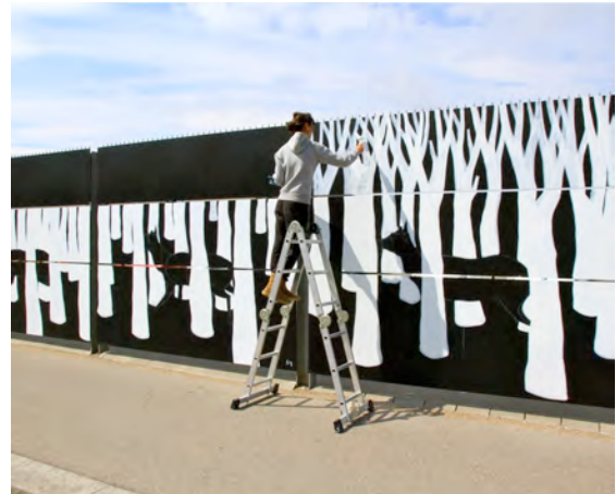
Fig.2a y 2b. Dos fragmentos de In Between de Hyuro (2013)