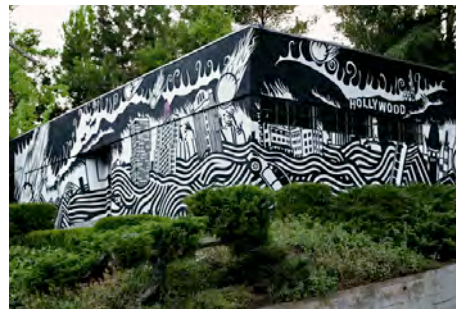
Fig. 6a y 6b. Vista exterior de XL Recordings (Los Ángeles, 2013)