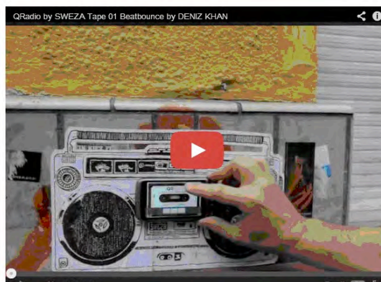
Fig.9 QRadio (Berlín, 2011). Proyecto interactivo de Sweza.

Otro ejemplo de graffitis interactivos son las propuestas de Sweza. En ellas se requiere la interacción del peatón provisto de un lector QR de un smartphone para visualizar la obra que nos propone el artista. Por ejemplo, el proyecto QRadio 12 (fig. 9) -que empezó en 2011 y fue conmemorado en un show en Berlín el otoño pasado- donde el artista muestra la figura de un radiocasete y espera a que un paseante se detenga y complete la pieza faltante de la obra: Si utiliza el lector QR de su teléfono, aparecerá un casete en la pantalla y comenzará a sonar música en las bocinas. Es un lindo gesto que vincula a la cultura de la música en casete con los artistas callejeros. La animación en este caso no es propiamente visual, pero sí acústica.