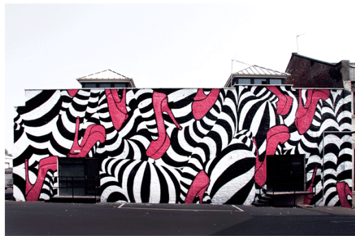
Fig.5 Insa, imagen del Gif-iti White Walls Project para Unit 44 (Newcastle, Inglaterra, 2011)

El proyecto Gif-iti White Walls Project para Unit 44 (fig. 5) fue filmado en Inglaterra durante su producción 8 y es un buen ejemplo del trabajo laborioso que comporta la realización de un graffiti animado.