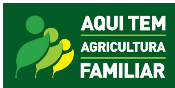
Gráfico 2 Selo da Identificação da Participação da Agricultura Familiar, SIPAF

En Brasil también existen instrumentos de promoción de la AF como el SIPAF (Sello de Identificación de la participación en la Agricultura Familiar, ver Gráfico 2), que es una marca de identificación de productos generados por los agricultores familiares y que tiene por objetivo fortalecer la identidad social de los productos de la AF visibilizándolos (FIDA Mercosur CLAEH, 2015).