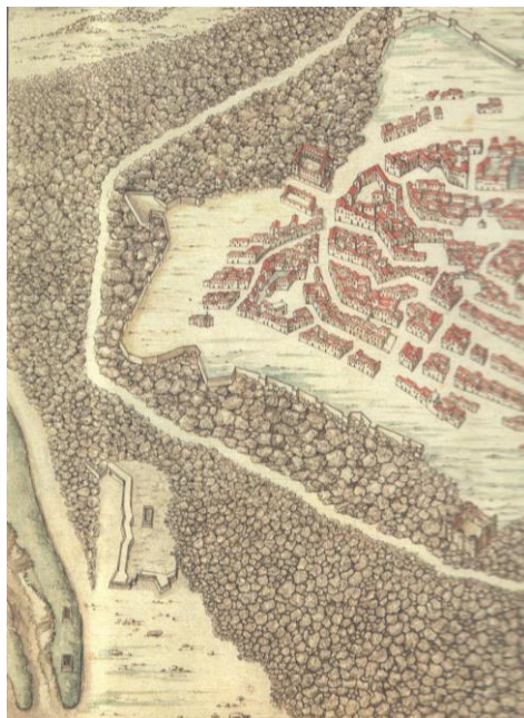
Fig. 2- Fortificazioni di Catania: disegno di autore ignoto della fine del Seicento

Similmente alla porta del fortino costruito al Pisano (del quale ci rimane un disegno del secolo XVIII) e realizzata su progetto del De Grunembergh in occasione della Guerra di Messina tra il 1674 ed il 1678, la Porta del Fortino Vecchio a Catania ha una semplice decorazione a bugne, ma, mentre in quella del Pisano le bugne seguono la forma dell'archivolto a pieno centro, in quella di Catania le bugne piane sono disposte attorno all'arco della porta secondo un profilo rettangolare che porterebbe ad ipotizzare anche la presenza di un ponte levatoio "doppio", come farebbe ipotizzare l'assenza di alloggiamenti per dei bolzoni e di fori per il passaggio di catene.