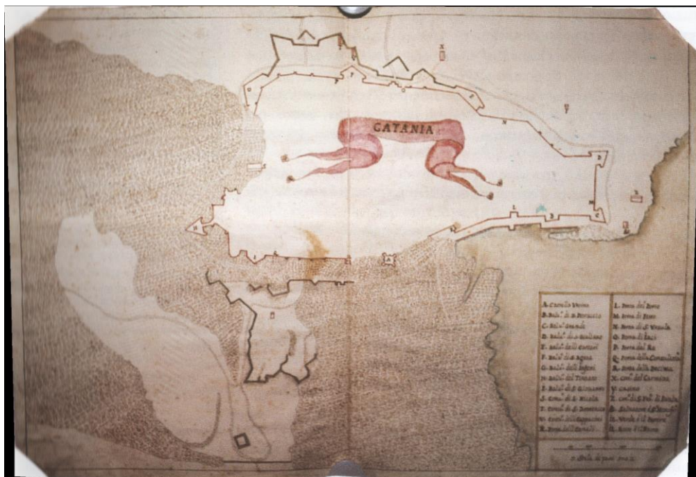
Fig. 1- Progetto di Don Carlos de Grunemberg per le fortificazioni di Catania al tempo del vicerè Castel Rodrigo (1676)

dalla corona spagnola, la quale mostrava invece uno spiccata propensione ad accentuare e favorire il ruolo della rivale Palermo come unica capitale del Regno di Sicilia.