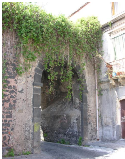
Fig. 5- I due prospetti della porta del Fortino Vecchio sulla via Sacchero, tra la modesta edilizia odierna.

Tra queste memorie oggi rimane indenne, se pur stravolta nei suoi connotati storico- tipologici, la porta denominata del 'Fortino Vecchio', costruita nell'area dell'antica stradella di approvvigionamento realizzata dal barone