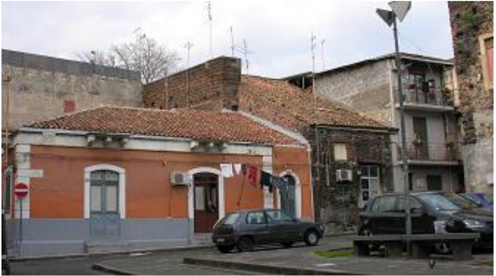
Fig. 3- Vista delle fortificazioni inglobate nel tessuto urbano da piazza Campo Trincerato