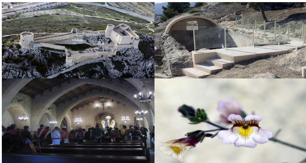
Fig. 2- Bienes culturales y naturales del Conjunt Patrimonial del Castell de Castalla: Castell de Castalla (Autor: Andrés Ruiz Sánchez), aljibe de la vila de Castalla, festividad de Sant Jaume (autor: Frederic Josep Cerdà i Bordera) y conejitos ( Chaenorhinum crassifolium subs. crassifolium ) (autor: D. Liñana Torres).

patrimonial. Un buen ejemplo lo representa el Castillo de Sax en cuya peña se localizan bienes culturales materiales (castillo, pozo de nieve, yacimiento arqueológico de la Edad del Bronce, cruz de la peña y vértice geodésico) y bienes naturales. En este sentido la peña está protegida como Paraje Natural Municipal. La principal diferencia entre ambos hitos patrimoniales (Castalla y Sax) se encuentra, en su gestión. Mientras que, en el caso del CPCC es global, la del Castillo de Sax es parcial. Es decir, no hay una administración conjunta y/o coordinada del patrimonio cultural y natural. Aunque, en principio, este hecho no significa que la gestión de Castalla sea mejor que la de Sax o viceversa.