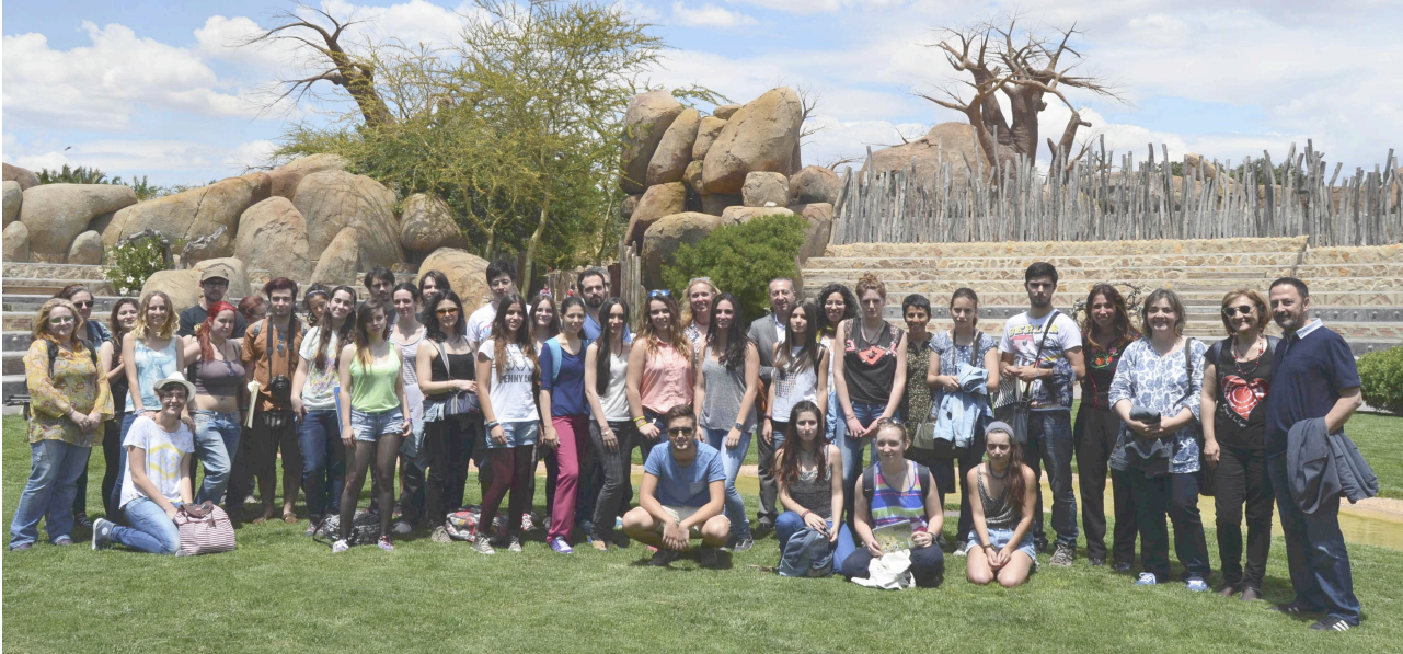
1. Participantes en el convenio y alumnos de las jornadas

Drawing will therefore be shown to be a real language in its own right and one that not only brings artists and public together, but also makes them aware of the importance of protecting the environment and preserving the world's remaining wild life.