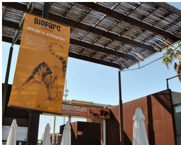
6. Cartel de la exposición en entrada Bioparc

Otro propósito de la exposición es mostrar a los alumnos las actuaciones que implica una muestra expositiva colectiva, como son entre otras: gestiones, organización, montaje, diseño de carteles, cartelas. Junto a ella, se ha editado un video divulgativo, que explica la importancia del dibujo en la formación artística, y la relación del dibujo y la animación con el mundo animal.