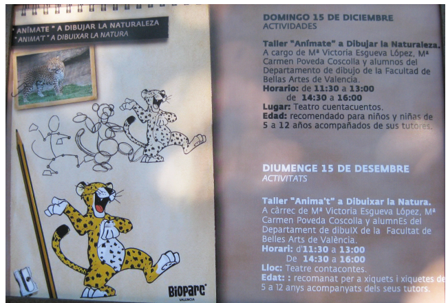
4, 5. Taller y díptico anunciador del taller