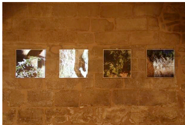
4. Atardecer en la vega del Riguel , 2012