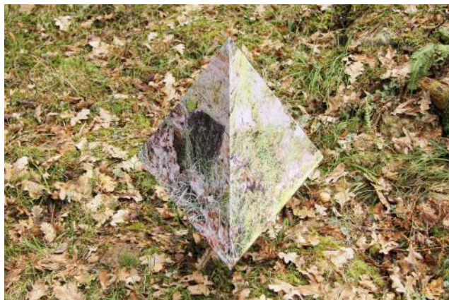
8. Saaren Tetraedri, 2014