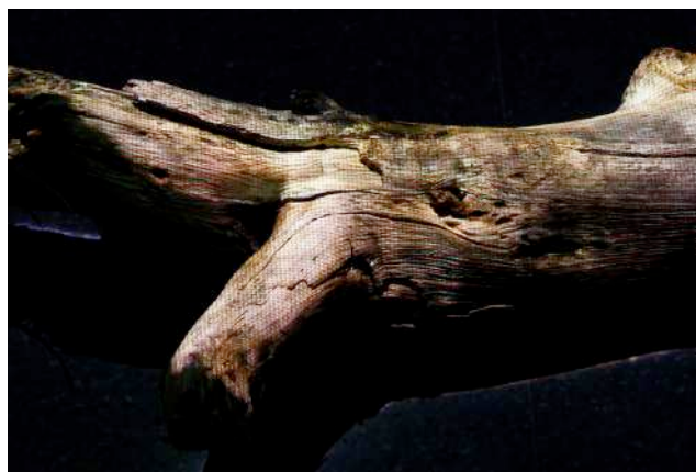
7. Tronco (automímesis) , 2013