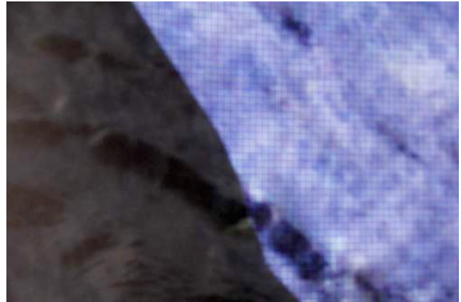
5. S/T , 2013