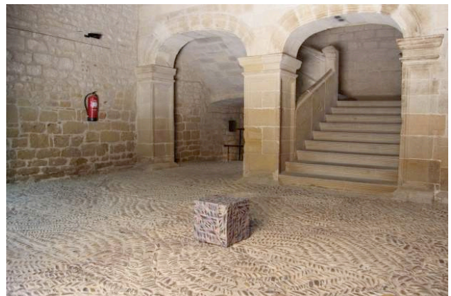
3. Stone-Box (proyecciones de Déjà-vu II) , 2012