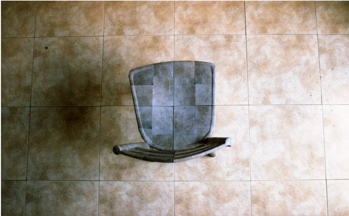
2. Silla; Proyecciones de Déjà-vu I , 2008