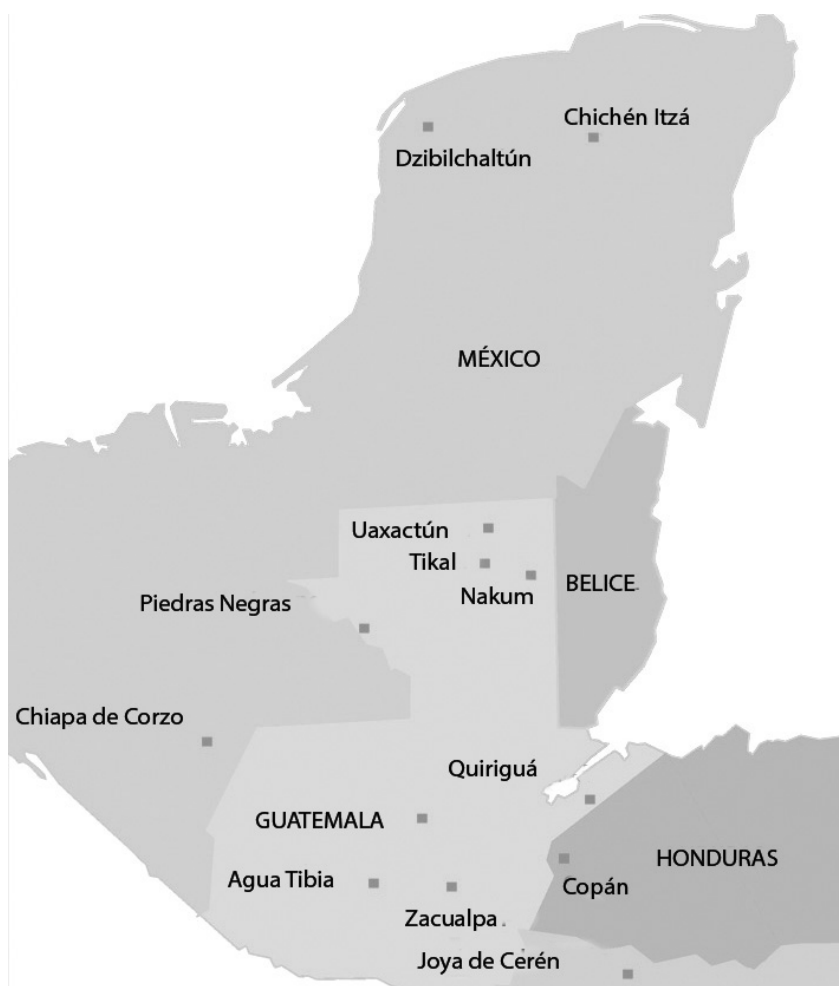
FIGURA 4. Ubicación de los temascales analizados en el área maya. Realizado por la autora.

Finalmente, se contabiliza un total de 18 casos de estudio completos: Estructura 605-2F de Dzibilchaltún, 1-11 a de Chiapa de Corzo, AV:R 7-8 de Uaxactún, 10L-223-2b de Copán, 3C de Zacualpa, 9 de Joya de Cerén, 5E-22 de Tikal, 1B-2 y 1B-3-1 o de Quiriguá, temascal de Agua Tibia, P7-1 o B, N-1-1 o B, S-19, 0-4 de Piedras Negras, 26 de Nakum y 3C15-anexo sur y 3E3 de Chichén Itzá (figura 4).