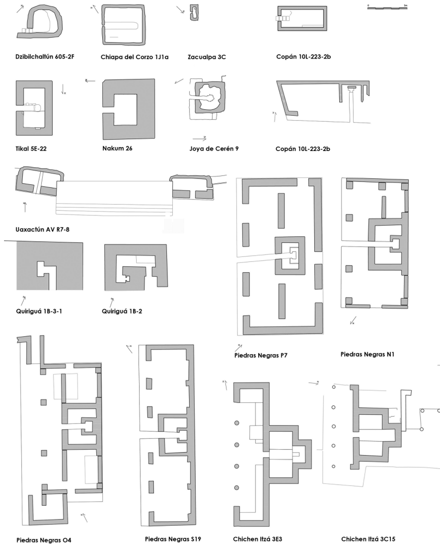
FIGURA 5. Plantas de los temascales analizados realizadas por la autora a partir de la documentación recabada. Dzibilchaltún (Andrews y Andrews, 1980), Chiapa de Corzo (Lowe y Agrinier y Lowe, 1960: 34-36 y Mason, 1935), Uaxactún (Smith, 1950 y Proskouriakoff, 1946: 111-133), Copán (Cheek y Spink, 1986), Zacualpa (Wauchope, 1948), Joya del Cerén (Sheets, 1992 y MacKee, 1997), Tikal (Jones, 1996 y levantamiento arquitectónico propio), Quiriguá (Morley, 1936a, 1938; Sharer y Ahmore, 1979, y Sharer et al. , 1983), Agua Tibia (Alcina et al. , 1980), Piedras Negras (Satherthwaite, 1952; Proskouriakoff, 1946; Child y Child, 2000, y 2001), Nakum (informes IDAEH y levantamiento arquitectónico propio) y Chichén Itzá (Ruppert, 1935, 1952; Morley, 1936b, y Tozzer, 1957).