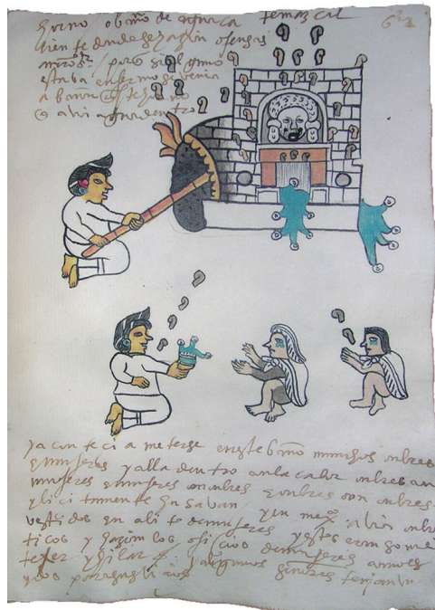
FIGURA 1. Códice Tudela, lámina 62 (frente).

terrenal y lo sobrenatural; lugares donde se rinde culto tanto al cuerpo como a las deidades. El estudio de los mismos implica profundizar en la cosmovisión maya, un adentramiento en esta civilización milenaria que reflejaba sus planteamientos sociales y políticos en el diseño de sus edificios.