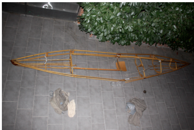
Ilustración 1. Umasensio, POUCH , kayak de madera de haya, 2017.

El proyecto POUCH (Ilustración 1) –de la voz inglesa, bolsa– de Umasensio, y comisariado por Miguel González-Diez, que se completa con su serie En casa (2014-2015), reivindica la práctica perceptiva como forma de exploración de otros modos de conocer el mundo y de sensibilizarse estéticamente con un equilibrio ecosistémico. La artista evidencia la naturaleza y el cuerpo como aquellos únicos lugares en los que es posible darse el habitar . El cuerpo sintiente sensible del que hablaba Maurice Merleau-Ponty surge como un elemento activo desde el cual alcanzar cuestiones fundamentales en el ser humano como la identidad, la empatía, la alienación y la inestabilidad.