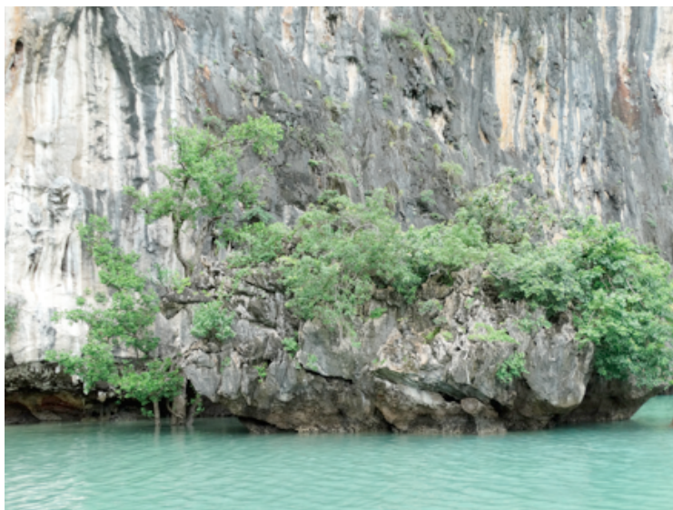
Ilustración 2. Umasensio, Manglares, 2015.

La ecosofía medioambiental afronta la difícil tarea ya no sólo de defender la naturaleza, sino de preparar "una ofensiva para reparar el pulmón amazónico, para reflorar el Sahara" (Guattari, F. 1996, 75). Así la incipiente necesidad de crear "nuevas especies, vegetales y animales, pertenece ineluctablemente a nuestro horizonte y hace urgente no sólo la adopción de una ética ecosófica adaptada a esta situación a la vez terrorífica y fascinante, sino también una política focalizada en el destino de la humanidad" (Guattari, F. 1996, 75).