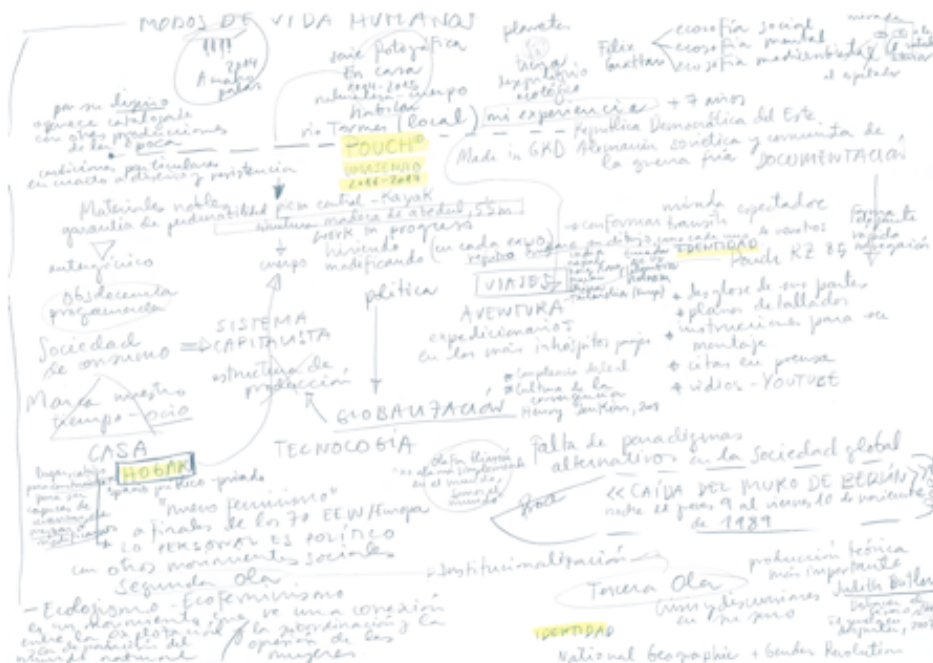
Ilustración 4. Umasensio, Cartografía POUCH, MUSAC, 2017.

En suma, POUCH como lugar de encuentro para una práctica eco/sófica/estética que piense nuevos modos de habitar (Ilustración). La piragua como cuerpo que viaja. Como cuerpo en el que viajar. La piragua como viaje. Pues como dice Umasensio, "somos lo que comemos. El planeta cambia en función de lo que comemos. Y en gran medida, también, las personas nos dividimos en función de lo que podemos comer" (González, M. 2015).