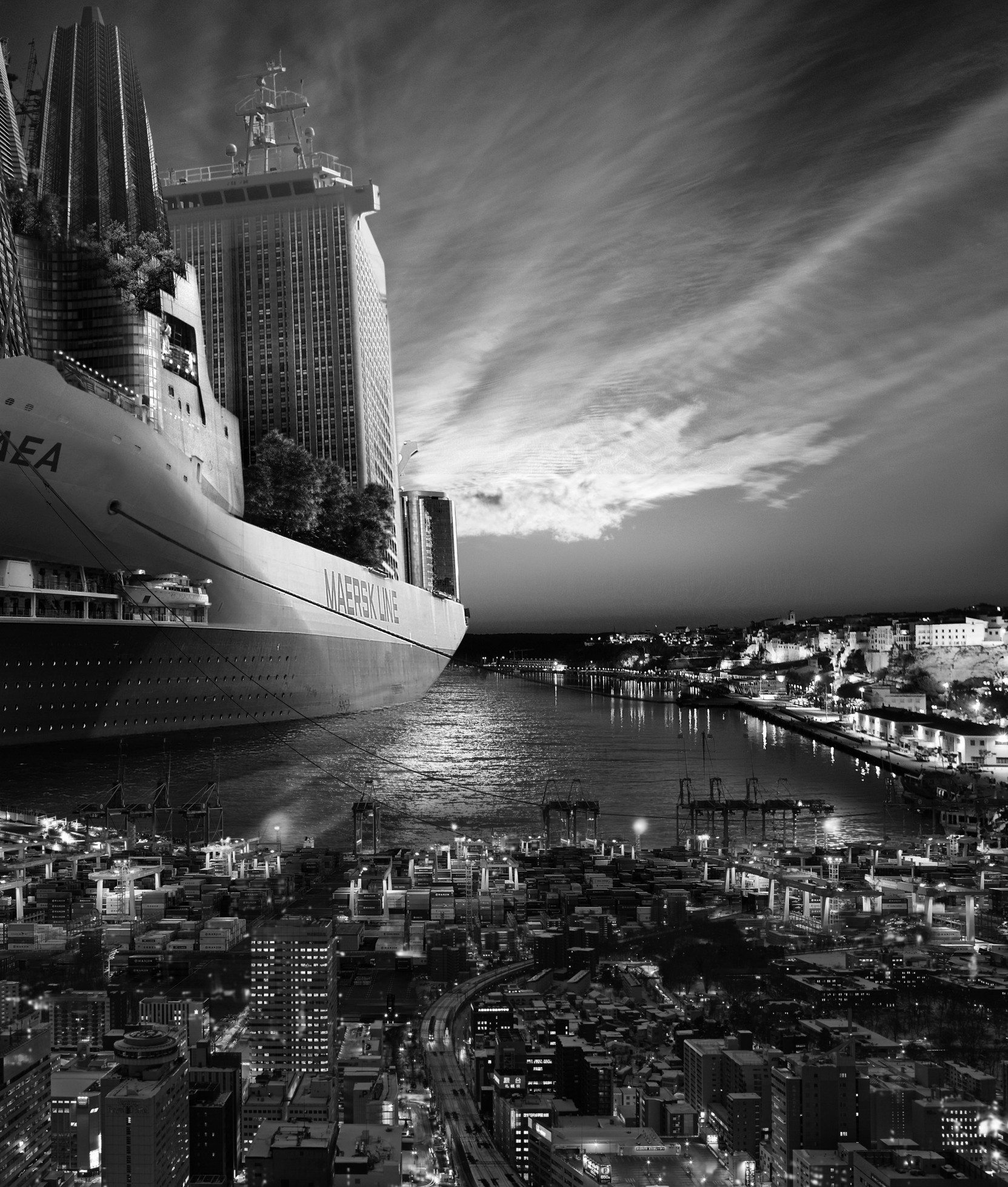
1. [1.1] Barbara Nati, 'Ship'. No Farewell, only Endless Goodbyes series (2012)