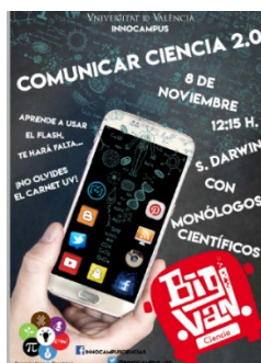
Fig. 4 Cartel promocional Mesa redonda "Comunicar ciencia".

Durante el presente curso, el Proyecto Innocampus Explora ha continuado su actividad focalizada en la visualización de la interdisciplinariedad en ciencia. Para ello se ha tomado como hilo conductor las “nuevas formas de comunicar ciencia” y se han organizado dos actividades complementarias. La primera de ellas, celebrada el 8 de noviembre (Fig. 4), ha consistido en la organización de la mesa redonda “Comunicar Ciencia” y en la misma los estudiantes han presentado y debatido sobre las distintas modalidades que actualmente se utilizan para comunicar ciencia: blogs, redes sociales, canales de youtube, literatura, cine, etc. En una segunda parte, se contó con la participación de los divulgadores de la “BigVan Ciencia” que presentaron dos monólogos científicos ampliamente celebrados (Fig. 5). La actividad fue seguida por cerca de 125 asistentes, la mayoría de los cuales la encontraron bastante (58%) o muy interesante (40%).