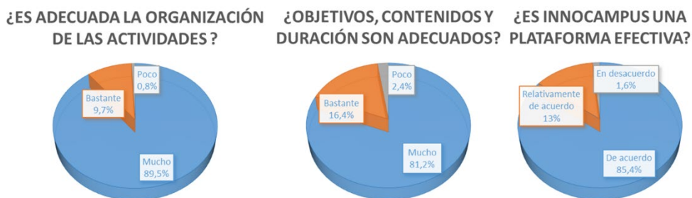
Fig. 9 Valoración de la adecuación de las actividades realizadas y de la idoneidad del proyecto para concienciar sobre la importancia de la interdisciplinariedad.

Por último, también se ha preguntado a los asistentes si consideran Innocampus una plataforma efectiva para concienciar sobre la importancia de la interdisciplinariedad en la ciencia, mostrándose de acuerdo el 85,4%, moderadamente de acuerdo el 13% y únicamente el 1,3% en desacuerdo, figura 9.