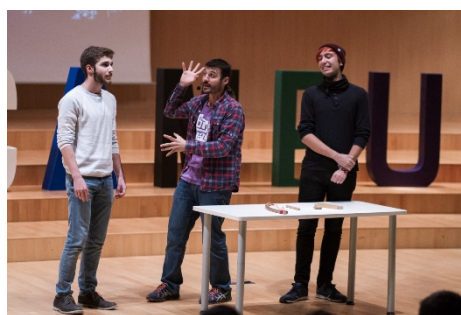
Fig. 5 Un momento de la actuación de BigVan Ciencia.

La segunda actividad, celebrada el 28 de febrero (Fig. 6), ha consistido en la proyección, y posterior coloquio, del documental “El enigma Agustina” dirigido por Manuel González y Emilio García (2018). El coloquio, apoyado por una presentación audiovisual preparada por la organización, se enfocó hacia las “otras Agustinas”, las pioneras de la ciencia española que, en muchos casos fueron represaliadas tras la guerra civil y siempre poco reconocidas en su trabajo. Esta actividad nos ha permitido mostrar con un gran ejemplo, cómo el cine puede ser utilizado para comunicar ciencia siguiendo el camino recorrido por otros autores (Serrano, 2003; Gallego, 2007). Además, dada la temática y contenido de la película, también nos permitió tratar otros temas importantes como son el papel de la mujer en la ciencia española y la memoria histórica en relación con la actividad científica en nuestro país. La actividad fue seguida por algo más de 100 asistentes que además de criticar muy positivamente el documental la consideraron muy (77%) o bastante interesante (14%) (Fig. 7).