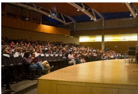
Fig. 2 Asistentes a la mesa redonda Cerveza y ciencia .