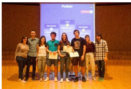
Fig. 3 ganadores del Kahoot de “¿Es científico el cine?” con alumnos de Innocampus Explora.

La segunda actividad fue una mesa redonda, coordinada por el profesorado, que tuvo por título “La ciencia... ¿con o contra el crimen?” (1 de marzo de 2018). Esta mesa contó con la intervención de profesores y profesionales que analizaron en qué medida la ciencia puede ayudar a cometer, pero también a resolver, actos delictivos. Se discutió si los conocimientos científicos que adquirimos en los diferentes grados científicos nos permiten acceder al ejercicio profesional contra el crimen en todas sus variantes. Nuevamente organizada por los alumnos miembros del proyecto, la mesa redonda contó con una competición interactiva mediante la herramienta informática “Kahoot”. Se entregó un obsequio a los tres participantes que obtuvieron mayor puntuación.