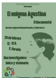
Fig. 6 Cartel promocional de la proyección del documental "El enigma Agustina".