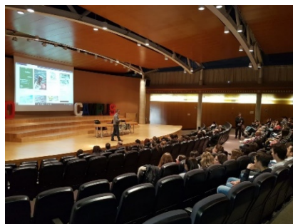
Fig. 7 Asistentes a la proyección del documental "El enigma Agustina".